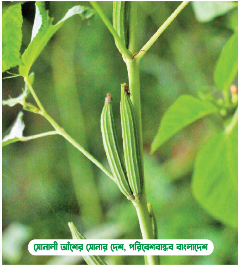
মোনালী আঁশের মোনার দেশ, পরিবেশবান্ধব বাংলাদেশ