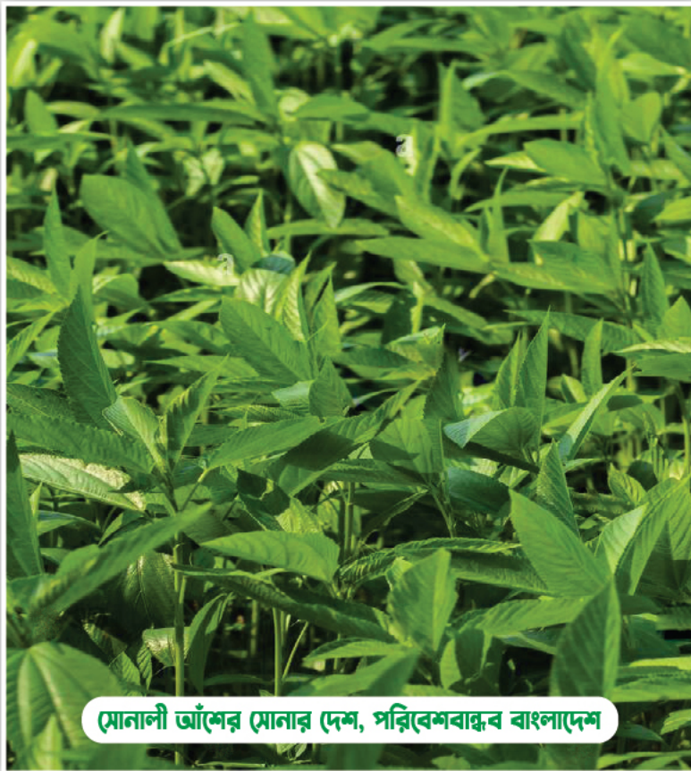
মোনালী আঁশের মোনার দেশ, পরিবেশবান্ধব বাংলাদেশ