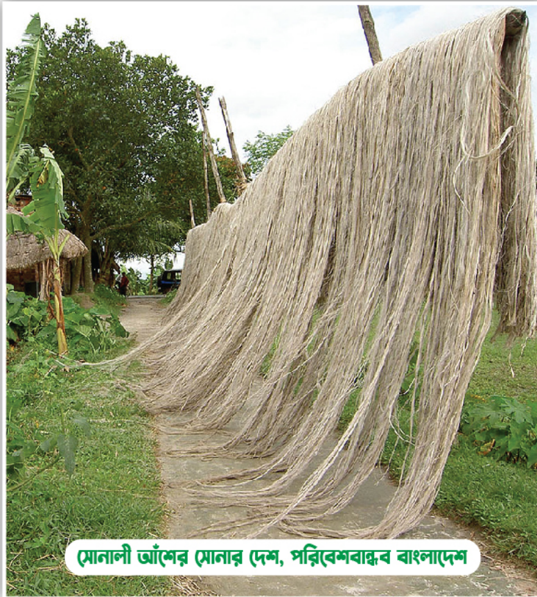
মোনালী আঁশের মোনার দেশ, পরিবেশবান্ধব বাংলাদেশ